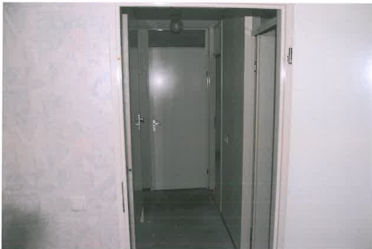
Overloop 1 ste verdieping