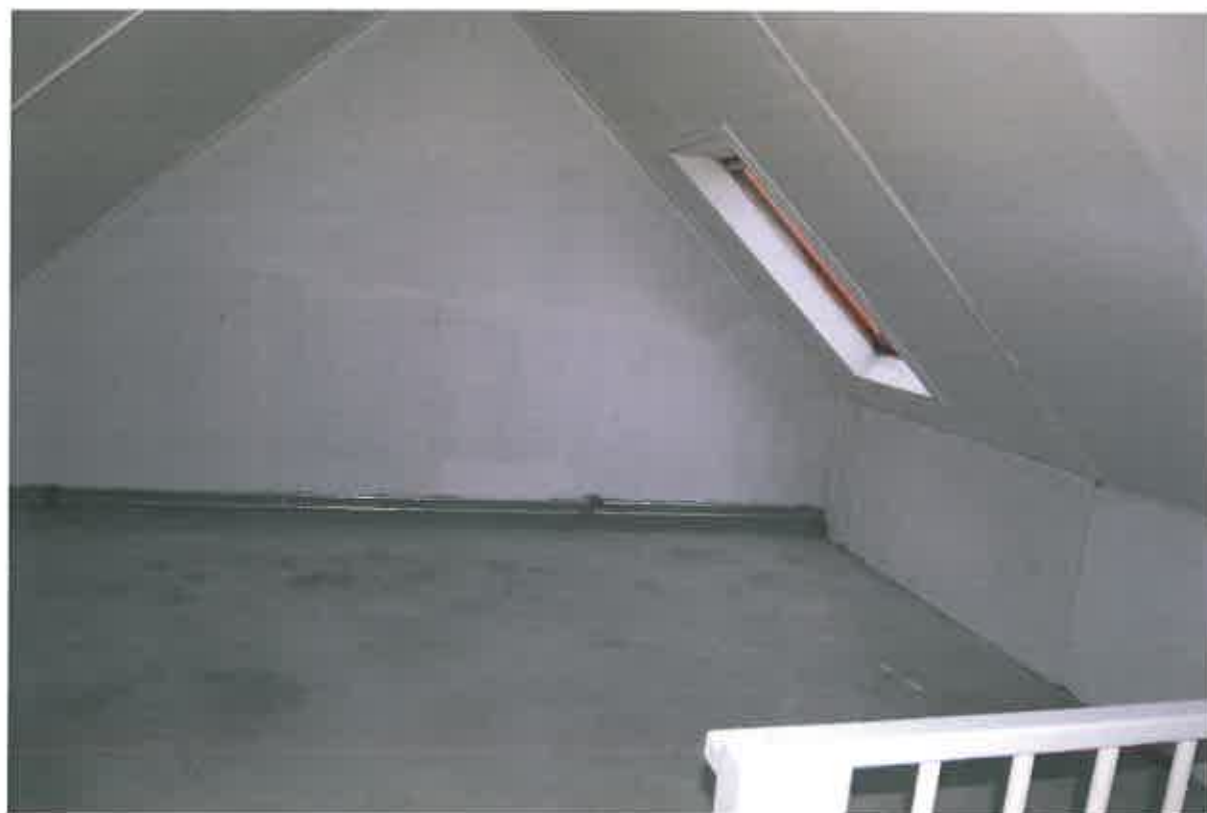
Ruime zolder (mogelijke 4 de slaapkamer)