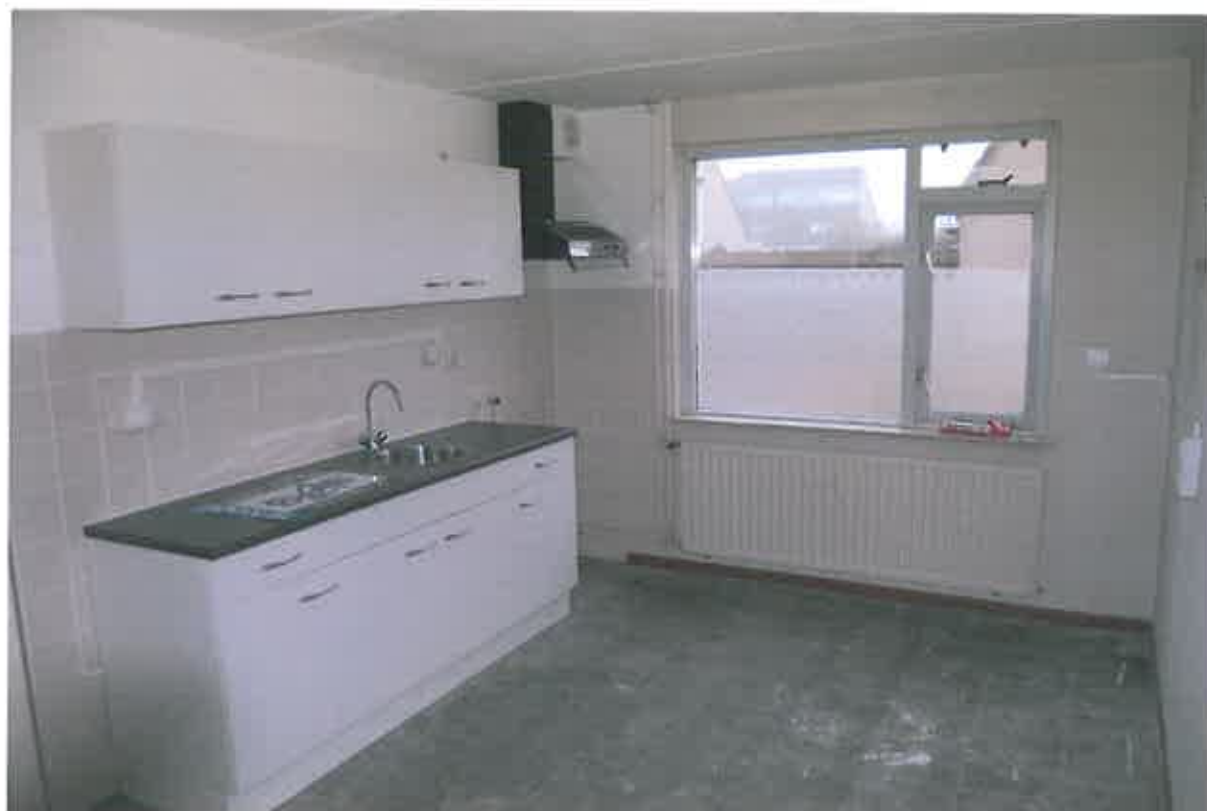
Open keuken met nieuw keukenblok