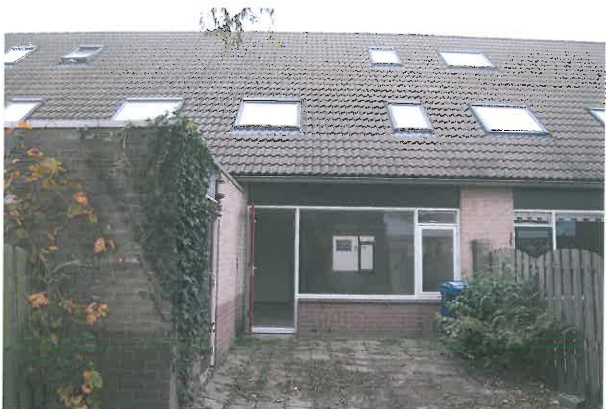
Achterkant met stenen berging